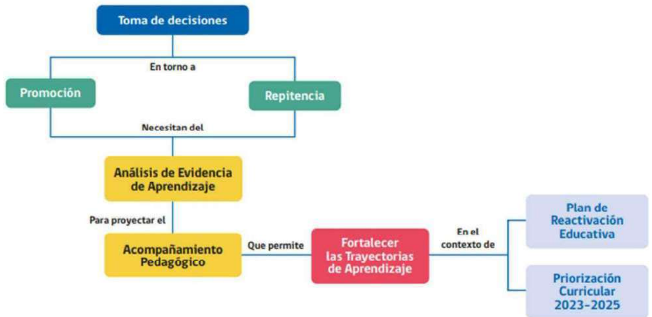
Figura 1: Toma de decisiones en torno a promoción para fortalecer trayectorias de aprendizaje.